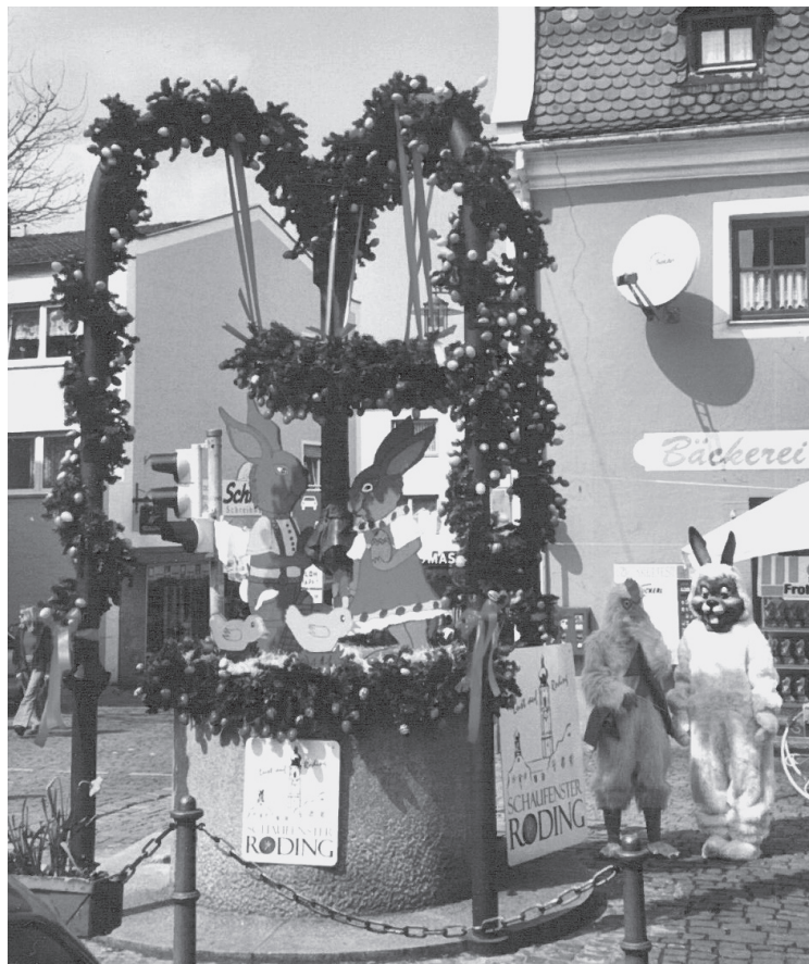
Osterbrunnen in der Garnisonsstadt RODING